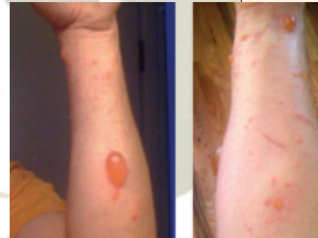
Blaren door contact met de gifsumak.

in alle delen van de plant. Mocht je de plant ooit tegenkomen dan afblijven! Als je die stof op je huid, in je ogen of in je mond krijgt dan kunnen er hele nare dingen gebeuren. In Nederland vind je deze plant maar op een enkele plek. Hij is hier niet invasief maar zou dat kunnen worden doordat de zaden door vogels verspreid worden.