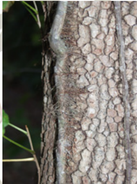
De gifsumak kan in bomen klimmen en houdt zich met 'haren' vast aan de stam.